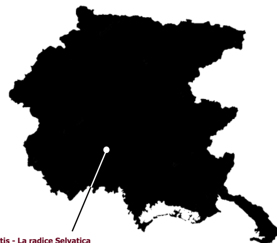
Villa Centis - La radice Selvatica

Centro di residenze artistiche e rassegna di arti dal vivo nata a Villa Centis di San Martino al Tagliamento , nei suoi due anni di attività da una parte ha portato in regione ospiti e spettacoli internazionali e nazionali, dall'altra guardato al territorio, supportando gli artisti locali e incentivando le produzioni friulane.